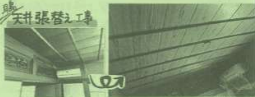
雨漏りのご相談。屋根(谷間)を通して、再塗装のぞきた天井と張替えました。