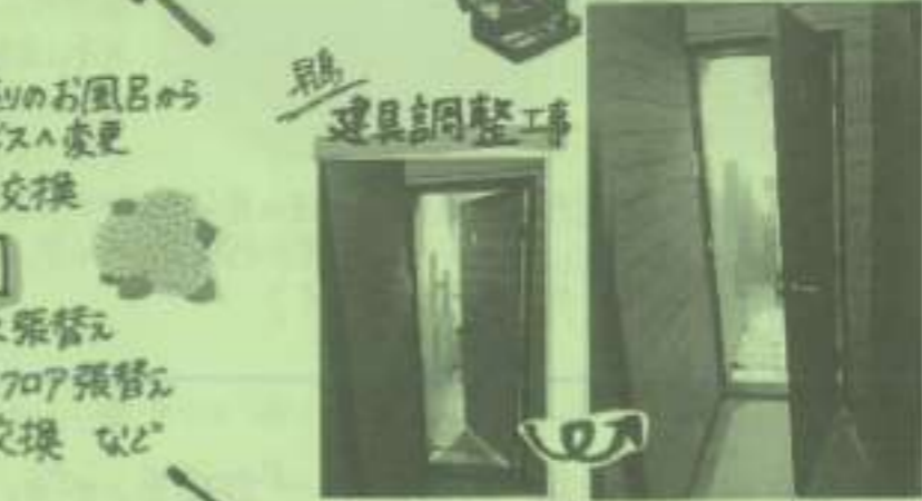
扉の開き方を内開き→外開きに変更しました