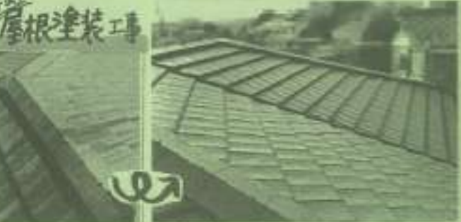
外壁の塗装を行い、新築のような外観になりました。