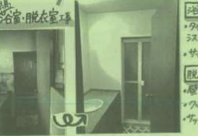
浴室・脱衣室工事