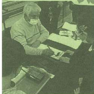
▲こちらが虚遊先生です