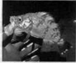
▲初めに1匹しか釣れなかったカサゴ