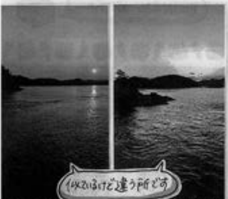
▲1回目の風景 ▲2回目の風景

ので、また来月号でご紹介します。 釣具店のメバルコンテストにエントリー しているのど、大きなメバルをドーンッと 釣りあげたいものぞう 😊