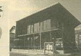
早島幼稚園のまん前の この建物ですよ