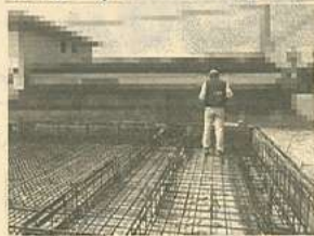
▲基礎配筋検査の様子